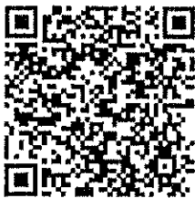
QR Code ๑