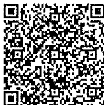
QR Code ๒